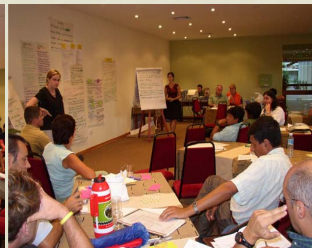
INTERCAMBIO SUR-SUR diseño de P.O.A Febrero 2006