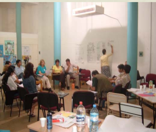
Taller Niagara College Setiembre 2005