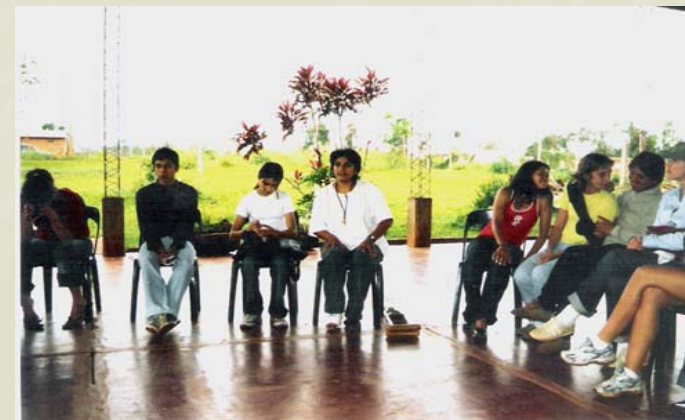
Talleres de Sensibilizacion. Barrio Primavera