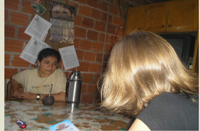
Entrevistas realizadas con Org. Sociales- Estudio de Genero