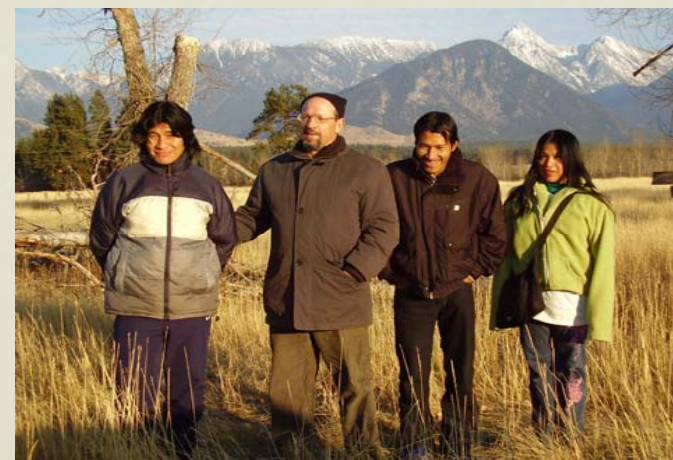
INTERCAMBIO CULTURAL CANADA-OCTUBRE 2007