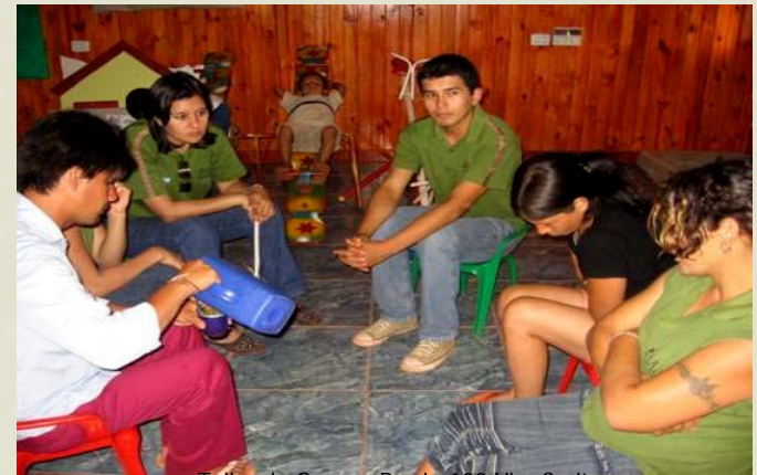
Taller de Genero-Barrio 100 Viv. Caritas